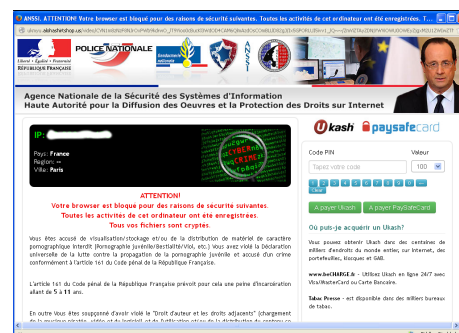
FIGURE 2 – Exemple d'écran d'information consécutif au blocage de l'accès à un ordinateur (BrowLock). Cliquer pour zoomer.