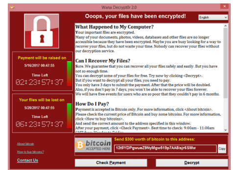
FIGURE 3 – Copie d'écran Wanna Cry. Cliquer pour zoomer.

L'extorsion de rançon est un modèle économique criminel bien établi. Son intérêt principal réside en un transfert financier direct entre la victime et le criminel.